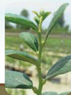
Formación de yemas