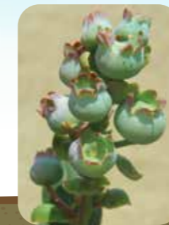
Crecimiento de fruto